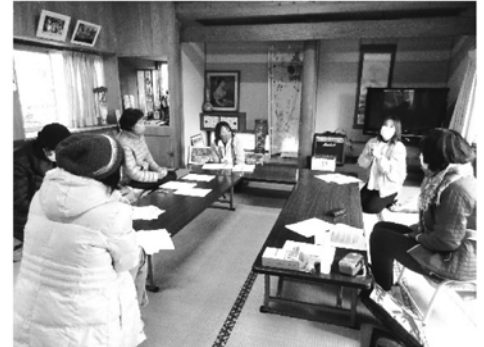
地区別ワークショップ

今後も社会福祉協議会の使命である住民が主体となる地域福祉推進のために、子どもから高齢者までが住み慣れた地域で安心して生活することができるよう、福祉のまちづくりを目指し役割を果たしてまいります。