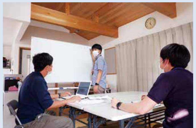
ケース会議の様子