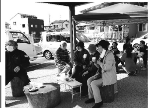
災害公営住宅お茶会