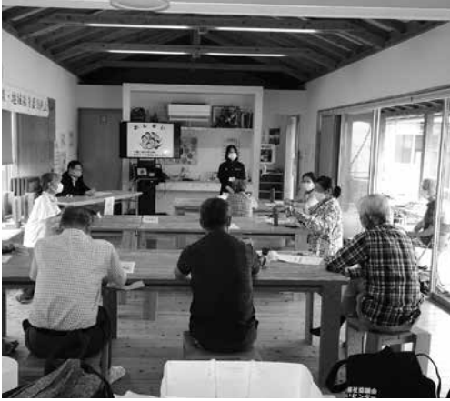
広安西・木山校区

7月19日(月) 木山仮設団地東集会所で開催し、今回は新型コロナウイルス感染症拡大防止のため、飯野・福田校区、広安西・木山校区、広安・津森校区の3つに分けて開催しました。