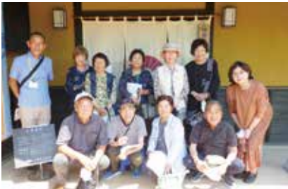
広崎1町内ふれあい会