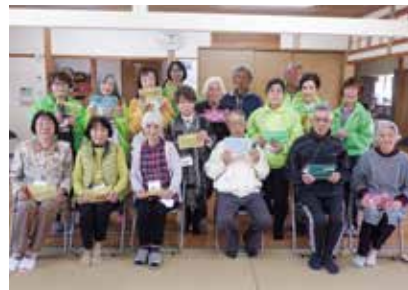
辻の城団地お楽しみ会