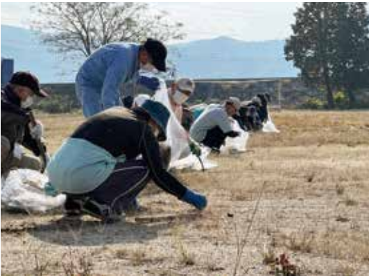
奉仕活動(旧中央小跡地)