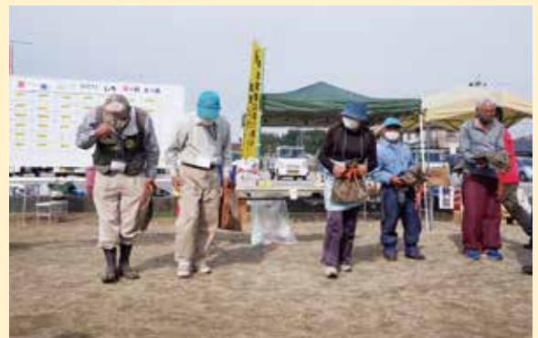
11月16日(火)に開催した奉仕活動後のレクリエーション(グラウンドゴルフ)での表彰式の様子