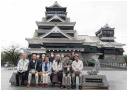
広崎3町内かたろう会