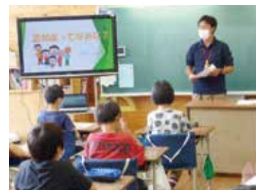
認知症サポーター養成講座 (益城中央小学校)