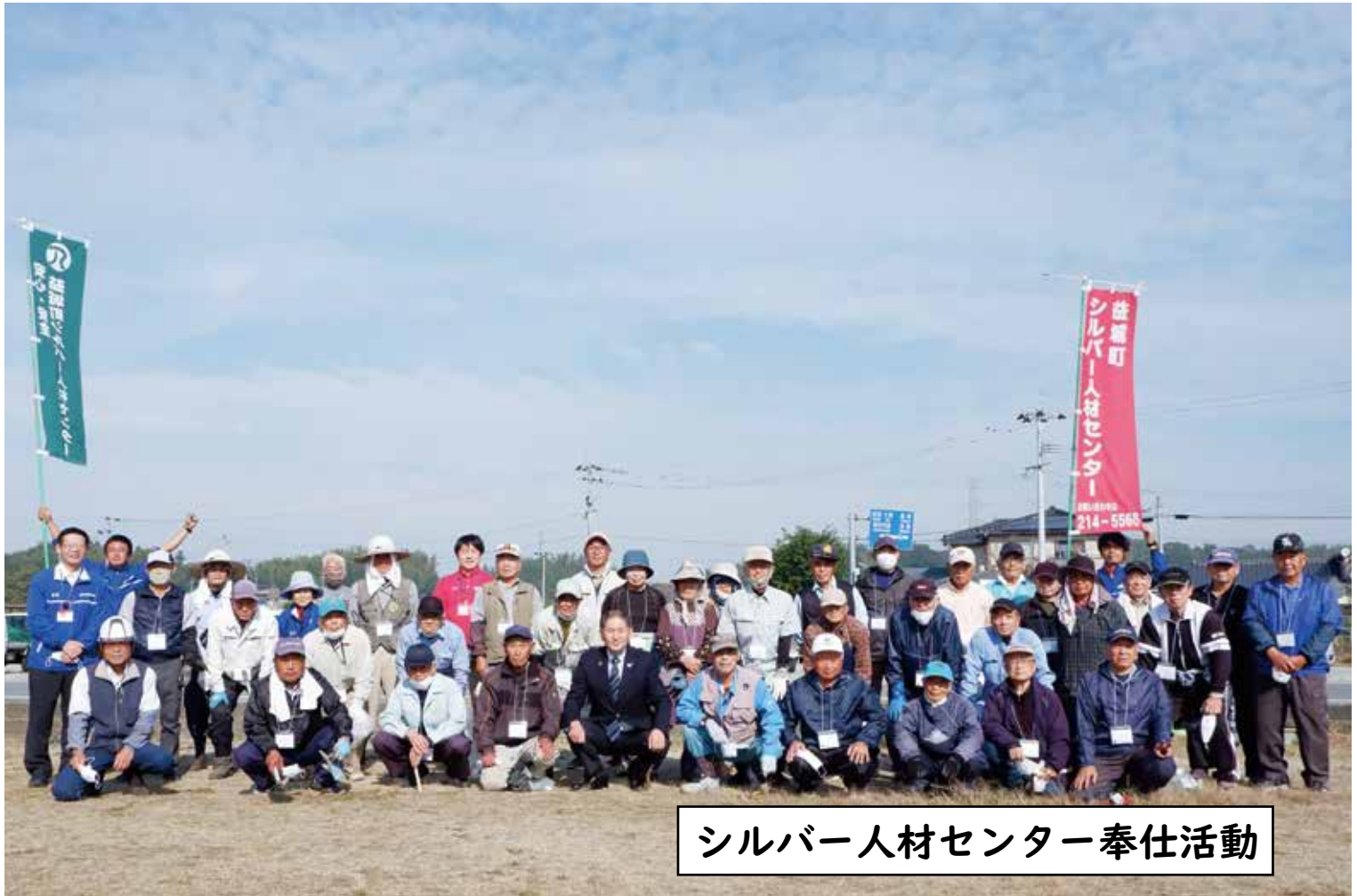
シルバー人材センター奉仕活動