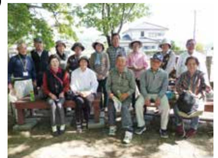
寺中アヤマサロン