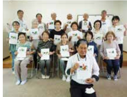
安永3町内ふれあいサロン