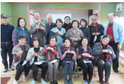
平田第一ふれあいサロン