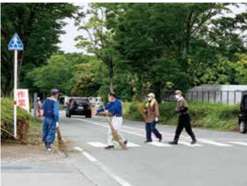
テクノリサーチパーク内作業