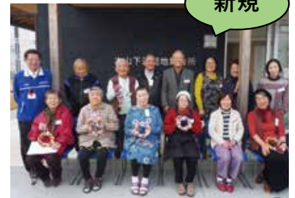
木山下辻団地サロン