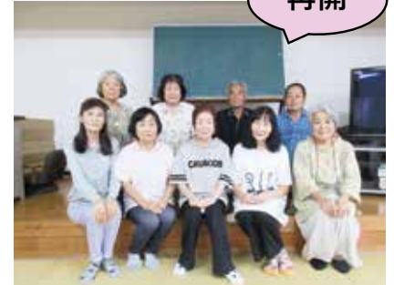
惣領4町内こがみサロン