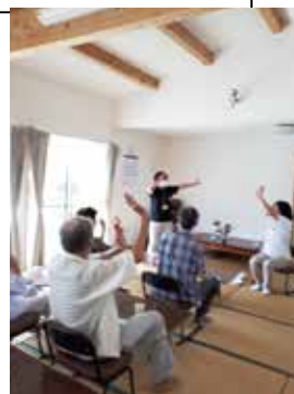
(認知症カフェ) オレンジサロン