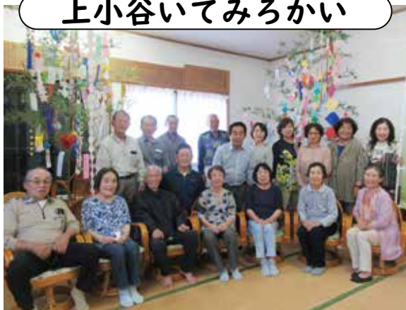
場所／上小谷公民館／日時／毎月15日 13時