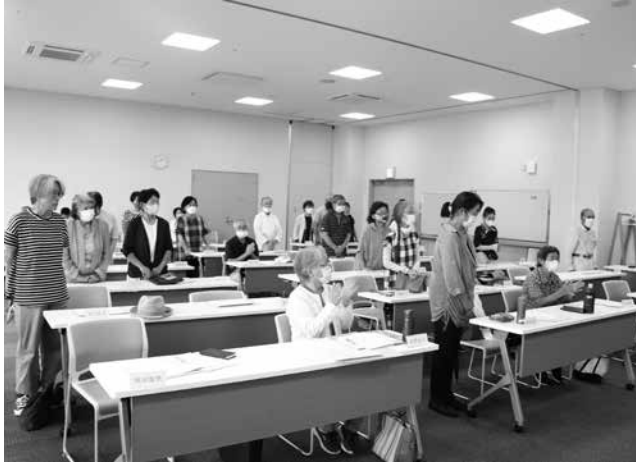
今回退任される委員さん