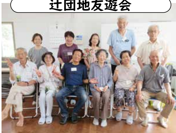
場所／辻団地集会所／日時／毎月第3水曜日 9時30分