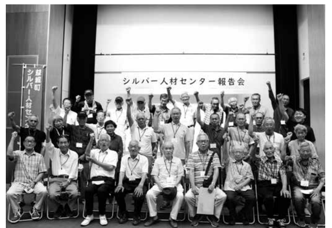
終了後記念撮影を行いました