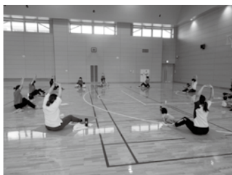
過去の親子講座の様子