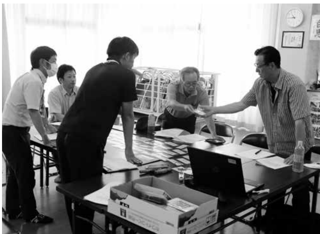
平田西福祉座談会の様子