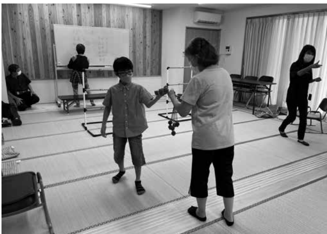
参加者と一緒にゲームを楽しみました(寺迫サロン)