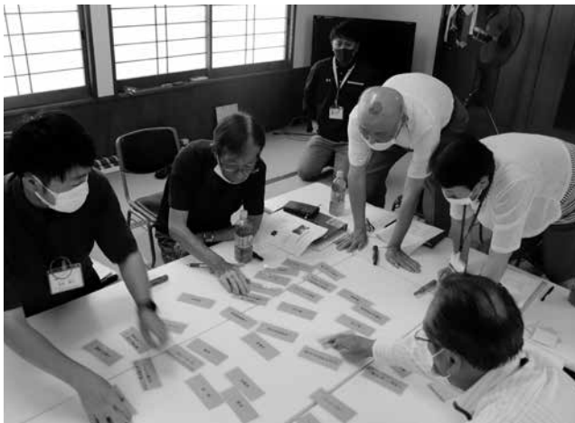
東無田福祉座談会の様子

平田西地区は、民生委員により毎月民協例会後の日曜日に1人暮らし高齢者宅を訪問されています。以前は、民生委員と高齢者相談・地域福祉委員がペアで訪問されていたようですが、それぞれ訪問して見守り回数を増やした方がいいだろうということで、現在はそれぞれで訪問されています。区長、民生委員ともに訪問や地域活動を通じて見守り対象の方の情報を把握できていました。