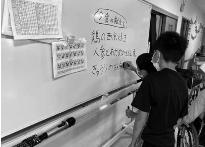
夕食の献立をホワイトボードに書いてお知らせします(くましき)

施設のスタッフの人は毎日色々なことをしてすごいと思いました。おやつのでりを一緒に作ったり、お誕生会をしたりたくさん体験をできて良かったです(小学5年生)。