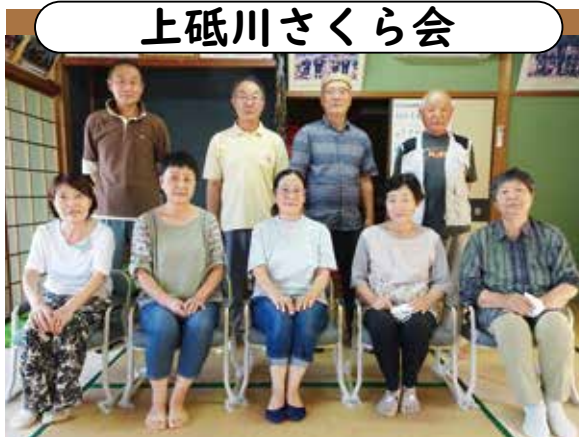
場所／上砥川公民館／日時／毎月第3水曜日 10時