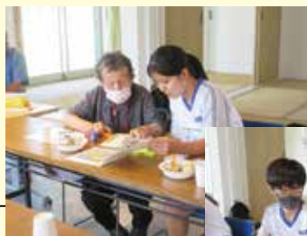
木山下辻団地サロンでの様子