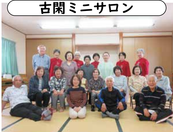
場所／古閑第二公民館／日時／毎月第4火曜日 10時