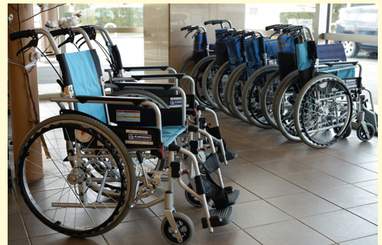
数に限りがありますので、事前にご相談ください