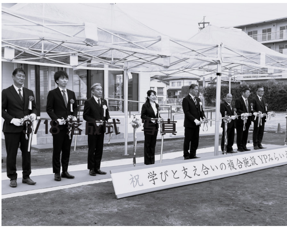
3月18日の落成式の様子