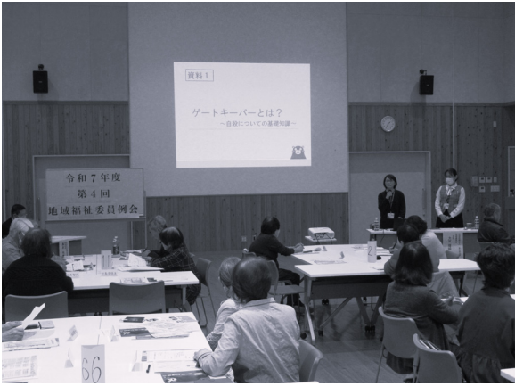
大事な「命」をつなぐために

日頃の見守り活動にすぐに役立つ実践的な内容とあって、参加者のみなさんはメモを取りながら、講師の話に真剣に聞き入っておられました。誰もが安心して暮らせる地域づくりのための大切な学びの場となりました。