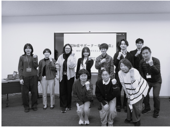
益城町役場で認知症サポーターとして活躍します

「出張講座も承ります！」 「今後も、職場や地域向けの講座を続けて開催してまいります。「うちの職場でも」「仲間のグループで話を聞いてみたい」という方、ぜひお気軽にご連絡・ご相談ください。」