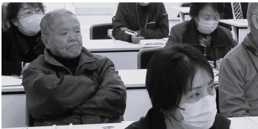
実践できるポイントに、熱心に聞き入る皆さん