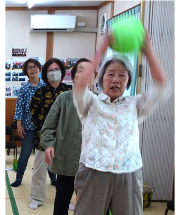
ボールレクで皆いきいき！