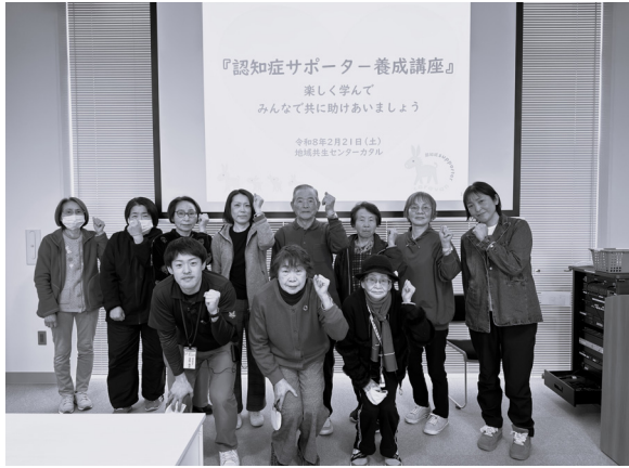
カタルで受講された皆さん