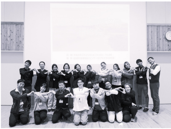
お互いに施設の枠を超えてつながっていきましょう！

まず、町内の認知症関連事業について、各担当者が説明を行いました。続いて行ったグループワークでは、「町