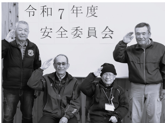
安全就業の徹底に務めます