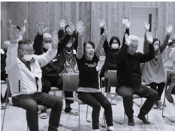
音楽に合わせて手拍子やリズム遊びを実践

今後もサロン運営を支えるサポーターを増やししながら、地域の皆さんが安心して暮らせるよう、見守りや集いの場づくりを続けてまいります。