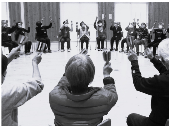
初対面のメンバーも、音楽ですぐ打ち解けました