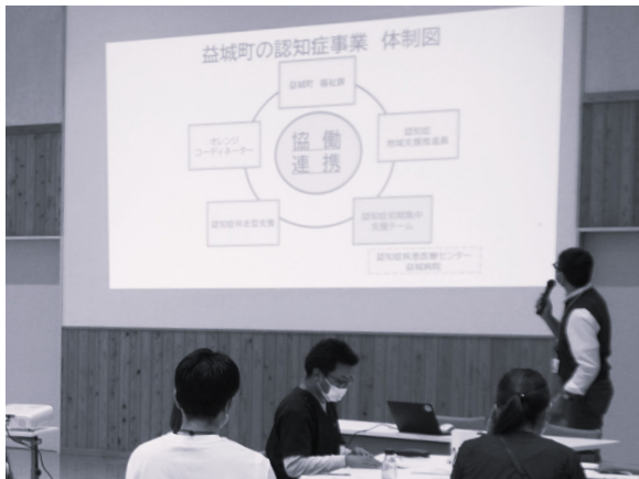
「協働連携」保健・福祉・医療の垣根を超えて

の認知症の取り組みと連携してやってみたいこと・つながりたいこと」をテーマに、参加者同士で活発な意見交換が行われました。