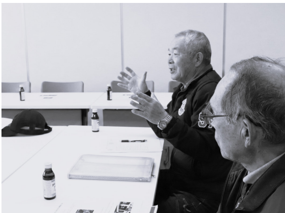
安全就業のために真剣に話し合いました

今年度は「事故ゼロ・けがゼロ」を目標に、シルバーパワー全開で、地域のみなさんのお役に立てるよう、