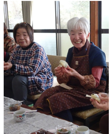
共に料理で会話が弾みます