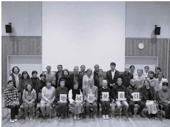
現在35名の地域福祉委員の皆さんが活躍中です！