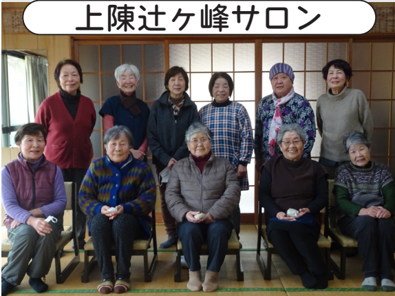
地域の仲間で、和やかなひとときを過ごしています！

平成19年の9月から始まったサロンは、毎月15名ほどが集まり、いきなり団子づくりや味噌づくりなど創作活動でいつも盛り上がっています。笑顔が絶えない素敵なサロンです。