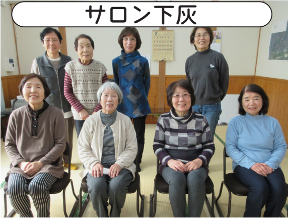
毎月の集いが地域のつながりを育んでいます。

平成21年の4月から始まったサロン下灰は、毎月10名ほどが集まり、介護予防や認知症予防講話、ハーモニカやクラリネットの演奏会など楽しく明るいサロン活動を実施しています。