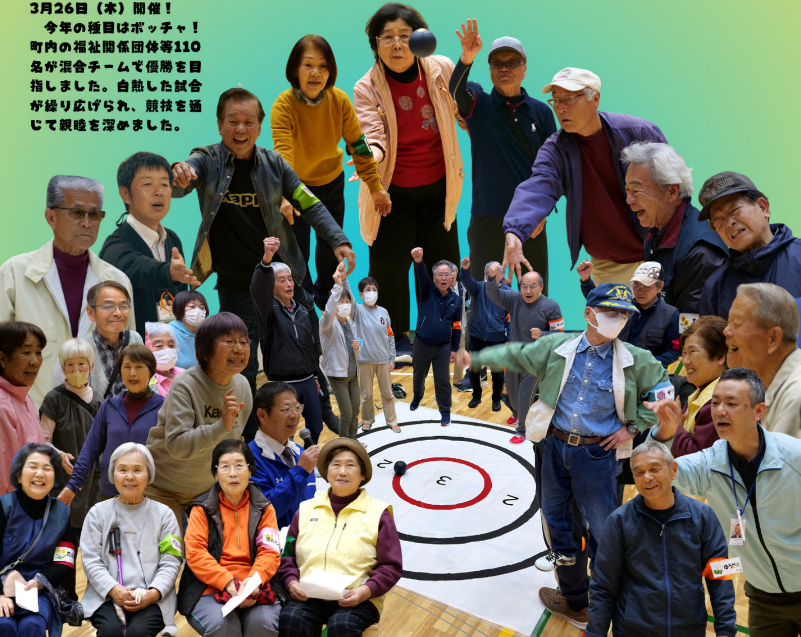
令和7年度福祉団体親善スポーツ大会

今年の種目はポッチャ！ 町内の福祉関係団体等110 名が混合チームで優勝を 目指しました。白熱した試合 が繰り広げられ、競技を通 じて親睦を深めました。