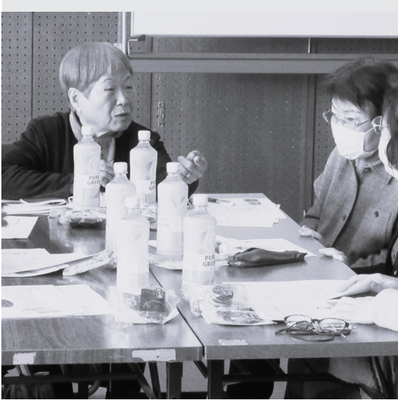
活発な意見交換が行われました