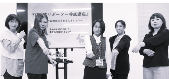
3.30 生協くまもと（本部）で受講された皆さん