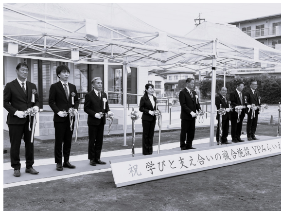
3月18日に落成式が執り行われました