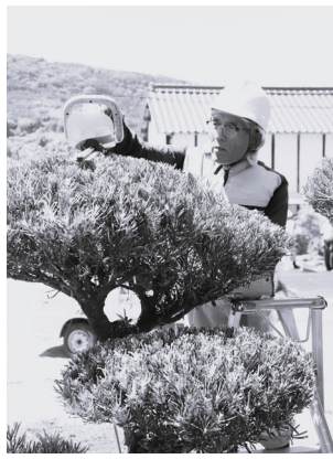
ご依頼お待ちしております！

口頃からシルバー人材センターを利用いただき、心より感謝申し上げます。この度、諸経費の高騰及び最低賃金の改定等により、令和8年8月作業分から料金の見直しを行う事となりました。今後とも変わらぬご愛顧とご理解を賜ります様、宜しくお願いたします。