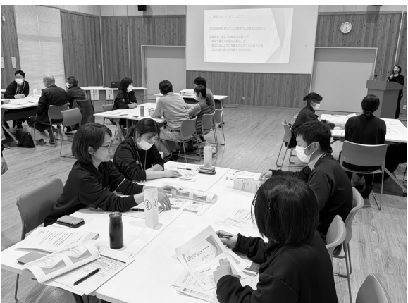
グループごと現場での経験や悩みを共有