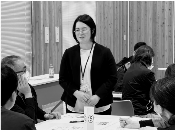
職種を超えた意見交換が行われました

益城町社会福祉士連絡会では、これからも地域福祉の推進と、誰もが自分らしく暮らせる益城町の実現を目指して、学びと活動を続けてまいります。