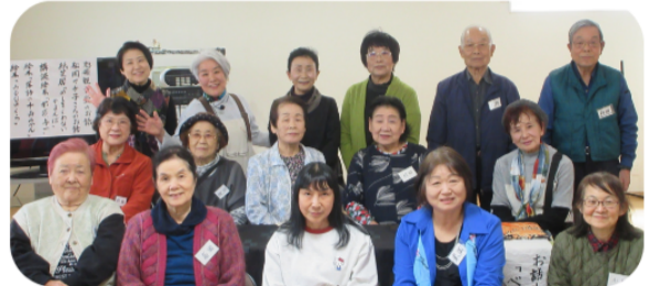
紙芝居、演奏会、みんなで夢中になりました！