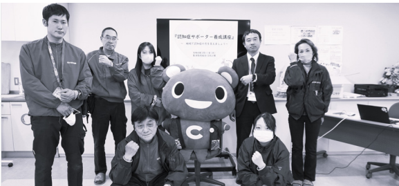
3.11 生協くまもと（東支所）で受講された皆さん

をされている方へ講座を行い、電話での対応の仕方について理解を深めていただく貴重な機会となりました。こうした様々な拠点での開催を通じて、今年も多くの「認知症サポーター」が誕生しました。今後も誰もが住み慣れた地域で安心して暮らし続けられるまちづくりを目指し、講座を開催してまいります。