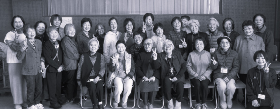
交流会に参加された皆さん

今回の交流会を通して、両団体は「地域の孤立を防ぎ、誰もが安心して話せる場をつくる」こと、そして「活動を長く続けるために利用者を増やすことや、何よりボランティアをしている自分たちが楽しむことが大切」という共通の思いを改めて確認しました。今後も連携を深めながら、地域に寄り添う活動を続けていきます。