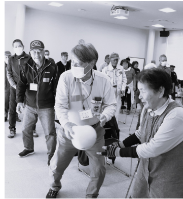
仲間同士で楽しくレクもしています！