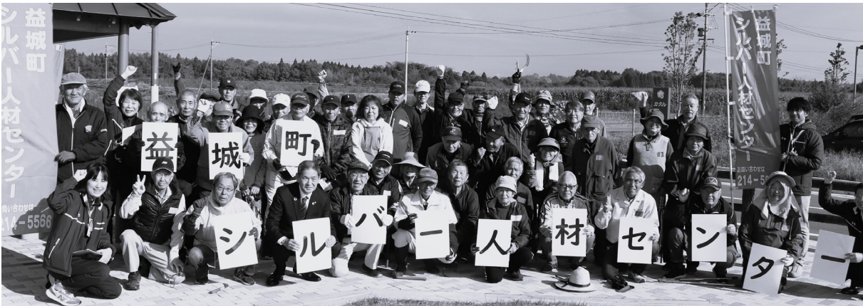
昨年11月の奉仕作業の様子 新規会員募集中です！詳しい活動内容の確認でも歓迎です！お気軽にご連絡ください！

今年度も各班ごと4日に分け開催しました。報告会では、センターの活動目的や理念を改めて確認した上で、年間の活動を振り返りました。安全委員からも、活動報告と来年度の安全対策・事故報告について説明し、事故防止に向け「何度も繰り返し伝える事が重要」と共有しました。報告会後は、意見交換会を行いました。作業をスムーズに進める方法や班内の連携の仕方、働きやすくなるための活発な話し合いが行われました。