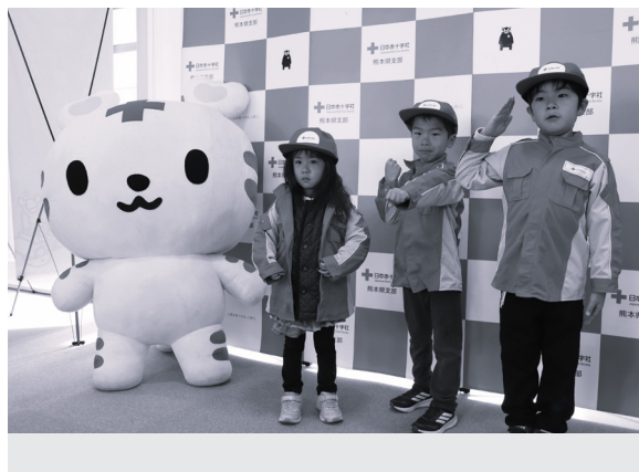
町総合防災訓練での周知活動の様子

こうした活動の積み重ねが、いざという時の地域の力につながります。今年度も引き続き、皆様のご理解とご協力をよろしくお願いいたします。