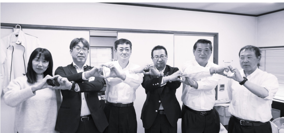
3.15 九州産交バス（株）木山営業所で受講された皆さん