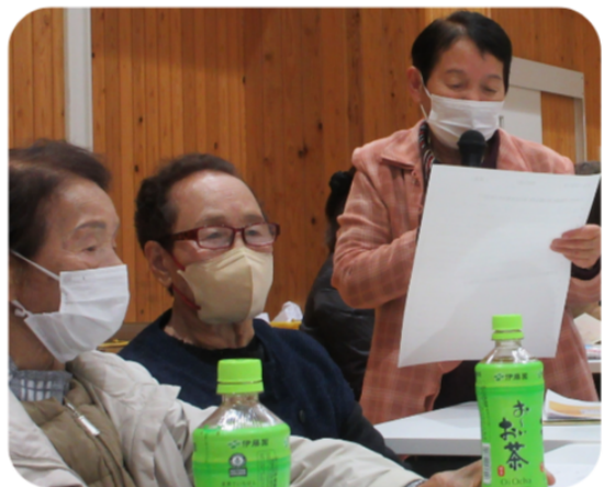
グループワークでの意見発表の様子

後半では、サロン運営に関する報告方法や助成金の申請手続きについて説明を行いました。