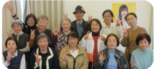
みんなで笑顔いっぱいの「ハイ、チーズ！」